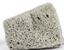
MISAPOR Standard Plus 10/50