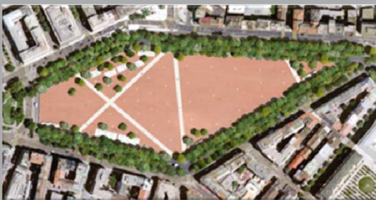
Zone traffico su edifici