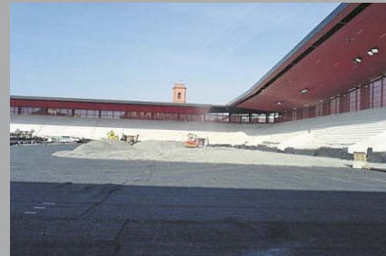
Drenaggio / Campi sportivi