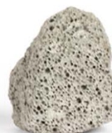
MISAPOR XtraDynamic 10/50