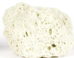
MISAPOR Greenlight 10/63