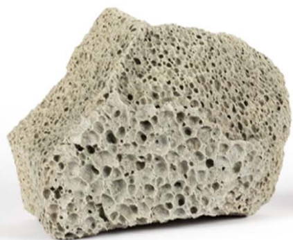
MISAPOR Standard 10/75