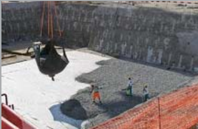
Isolamento perimetrale orizzontale