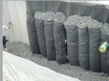
Isolamento perimetrale verticale